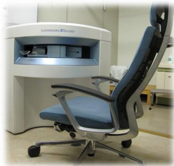
手専用コンパクトMRI